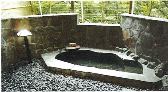
大浴場から露天風呂へ

立木の中に際立つ、採光を考えたバルコニーの外観が特徴の「 Grantピア丹沢・中川温泉」。古くから信玄の隠し湯・美人の湯とも呼ばれるかけ流しの天然温泉でくつろいだリゾートライフを満喫できます。